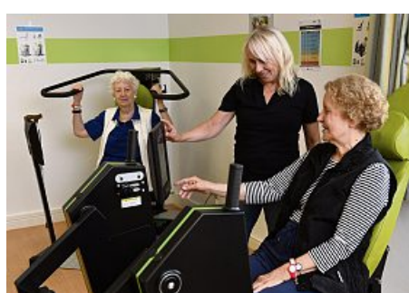
Bestform-Präventionsprogramm in St. Josef: Senioren trainieren, um Erkrankungen vorzubeugen.